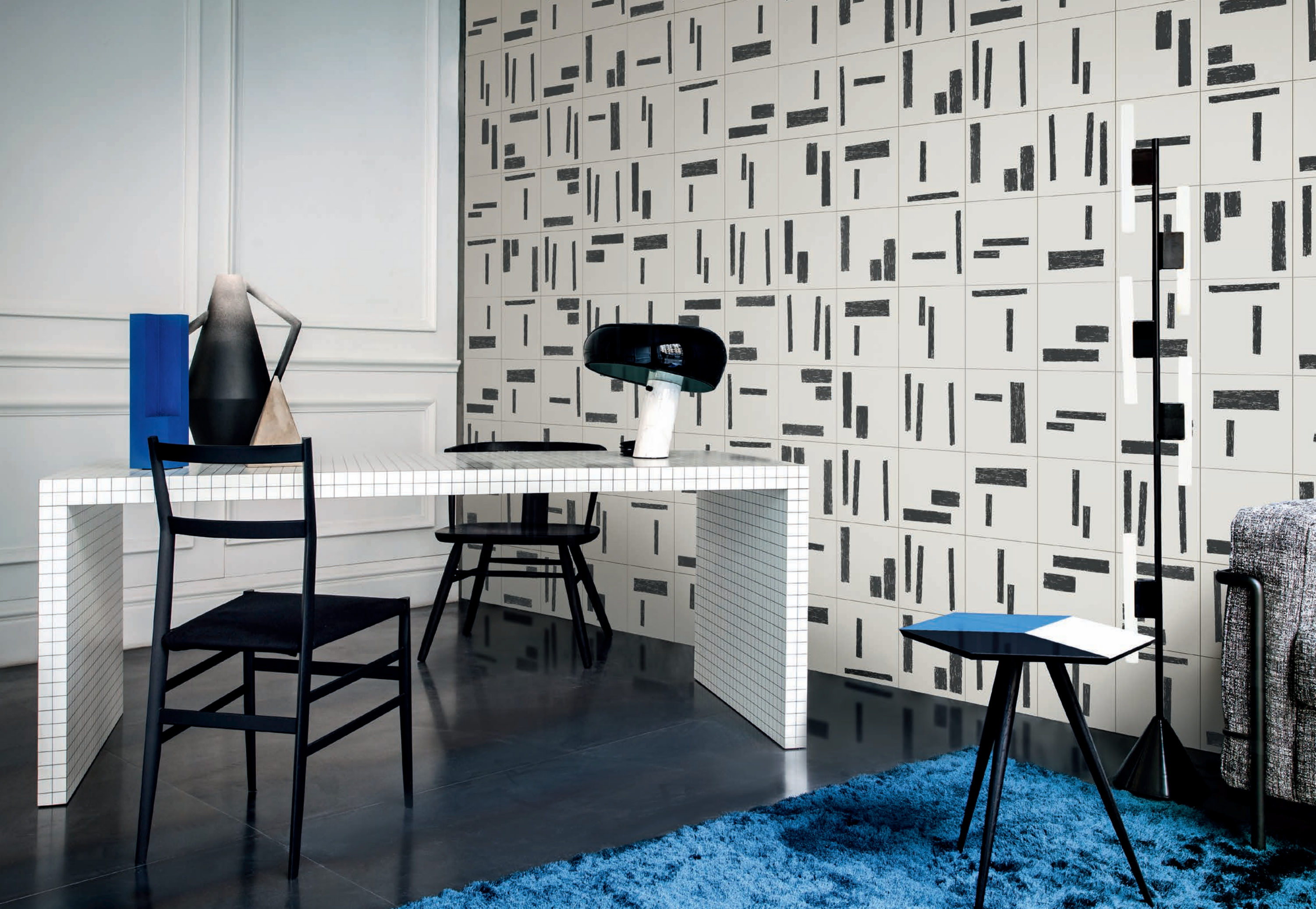
LIVING, rivestimento / covering PRIMITIVA 1 (cm. 25x25 - 10"x10")